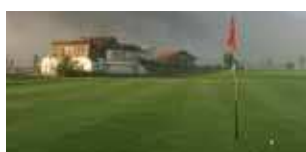
ÖSTERREICH Golfanlage Mittersill