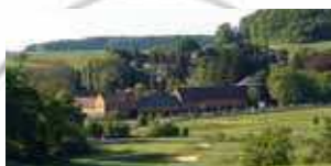
MITTE Golfanlage Winnerod