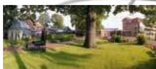
WEST Golf Resort Jammertal