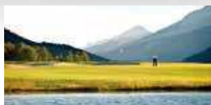
SCHWEIZ Golfanlagen Engadin