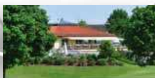
BAYERN Golfanlage Pfaffing