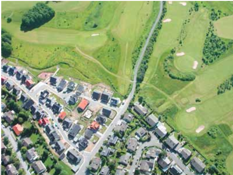
Bedarf für Schutznetze: Wohnsiedlung neben Golfclub

Golfschutznetze sind mehr als nur Vertrauenssache. Sie sind auch eine Frage der Ästhetik. Denn im besonderen Maß gilt, dass das harmonische Bild der Natur so wenig wie möglich unterbrochen werden darf. Mit unseren Netzen ist das kein Problem.