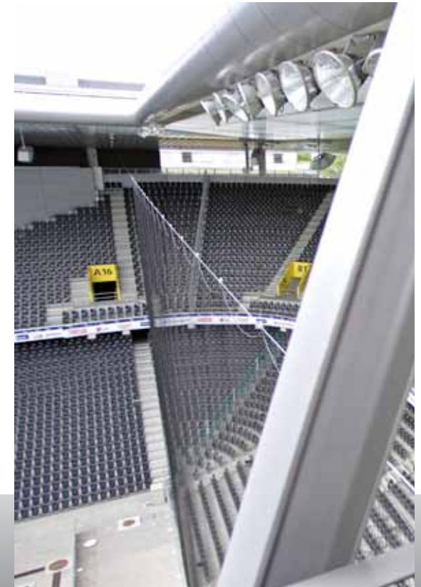
Hintertornetz, Stade de Suisse, Bern