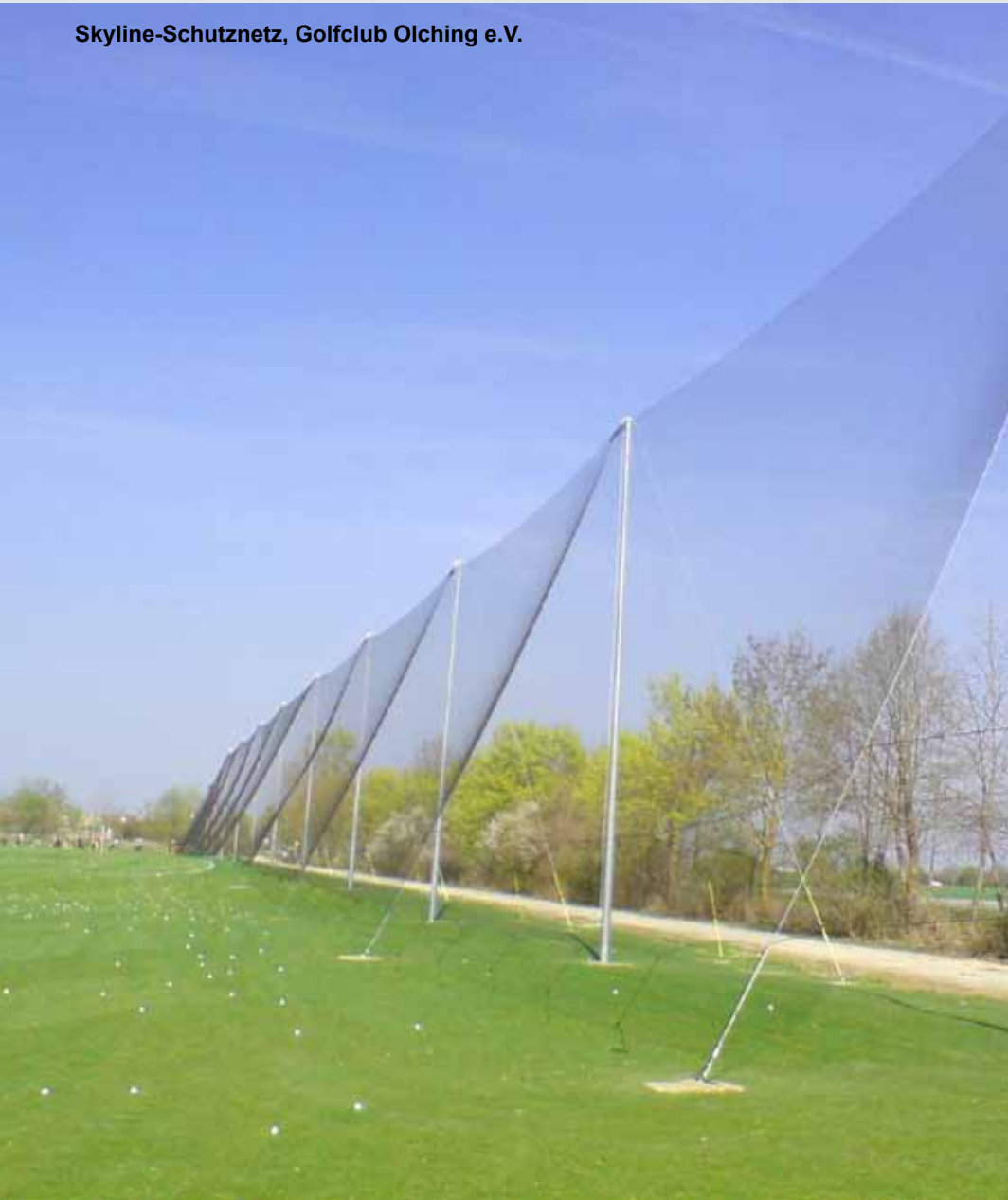
Skyline-Schutznetz, Golfclub Olching e.V.