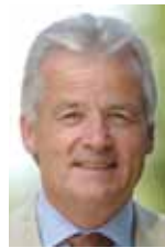
Ihr Alexander Freiherr von Spoercken Vorsitzender des Vorstands des Bundesverband Golfanlagen e.V.