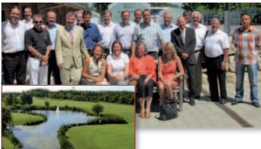
BVGA Regionalkreistreffen Baden-Württemberg: Golfanlage Schloss Monrepos