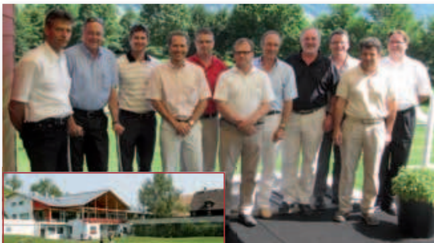
BVGA Regionalkreistreffen Schweiz: Golfanlage Küsnacht

Es hat sich gezeigt, dass durch die Qualität der Teilnehmer immer ein Mehrwert an know-how für alle Beteiligten erzielt wird. Ein Beleg dafür ist auch die immer höher steigende Teilnehmerzahl von BVGA-Mitgliedern und das wachsende Interesse von Gästen.