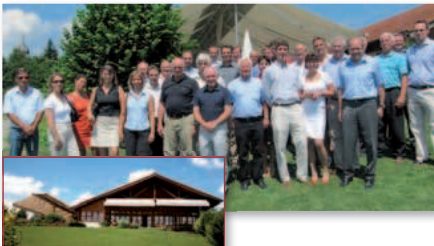
BVGA Regionalkreistreffen Bayern: Golfanlage Gut Rieden