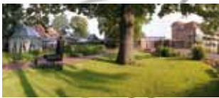
WEST Golf Resort Jammertal