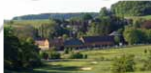
MITTE Golfanlage Winnerod