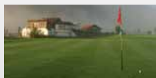
ÖSTERREICH Golfanlage Mittersill