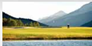
SCHWEIZ Golfanlagen Engadin