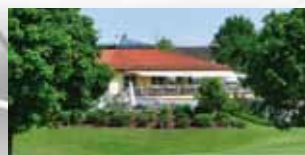
BAYERN Golfanlage Pfaffing