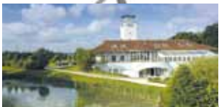
BADEN-WÜRTTEMBERG Golfanlage Schloss Nippenburg