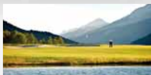
SCHWEIZ Golfanlagen Engadin