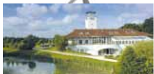
BADEN-WÜRTTEMBERG Golfanlage Schloss Nippenburg