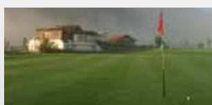
ÖSTERREICH Golfanlage Mittersill