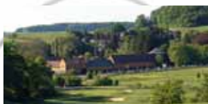
MITTE Golfanlage Winnerod