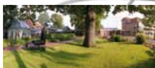
WEST Golf Resort Jammertal